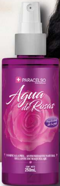
Agua de Rosas